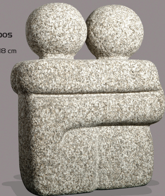
NAMORADOS Granito 48 x 38 x 18 cm 2008