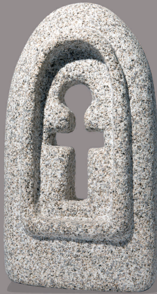
IGREXA Granito 46 x 24 x 12 cm 2000