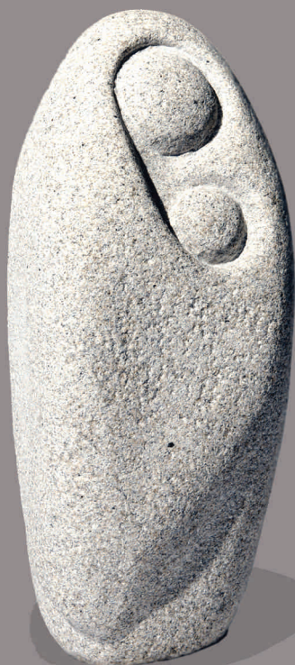
NAI E FILLO II Granito 44 x 17 x 17 cm 2010