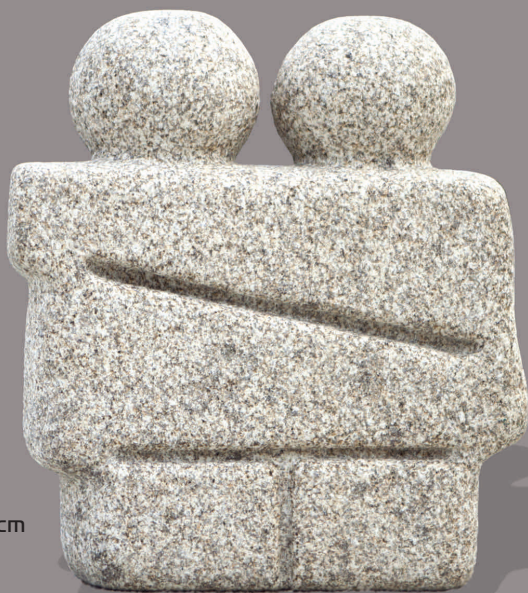
FUSIÓN Granito 49 x 42 x 18 cm 2009