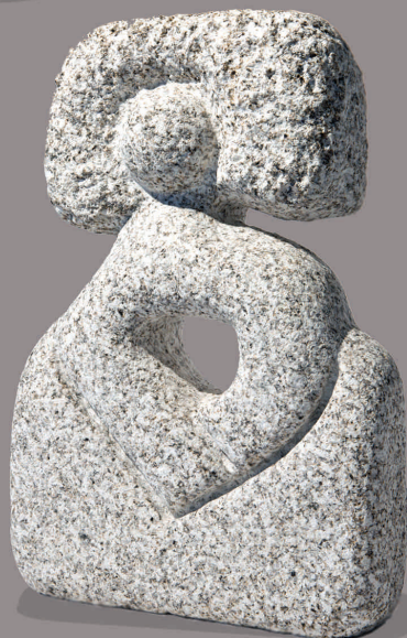
MENINHA II Granito 43 x 28 x 11 cm 2009