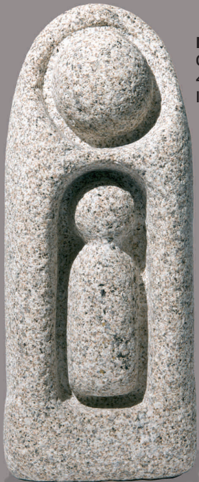
MATERNIDADE III Granito 45 x 18 x 11 cm 1998