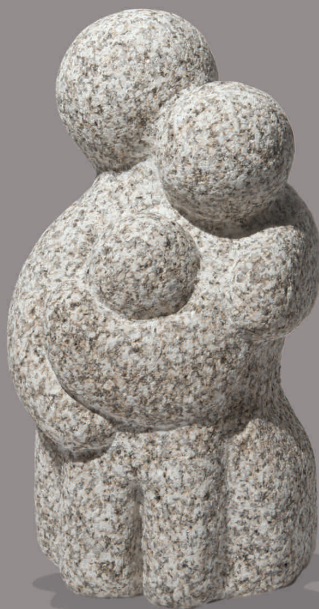
TRIO Granito 40 x 22 x 22 cm 2010