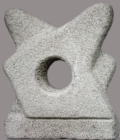
ÁS Granito 50 x 43 x 12 cm 2010