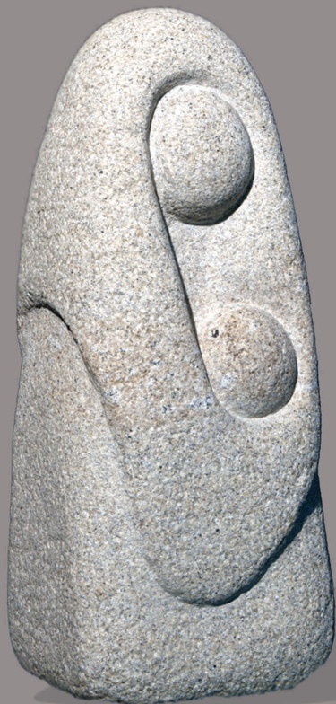
NAI E FILLO I Granito 45 x 18 x 17 cm 2009