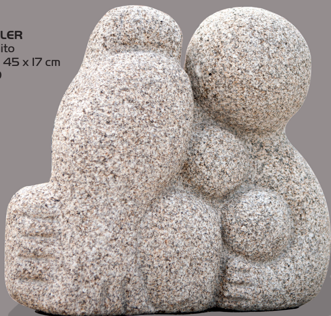
MULLER Granito 45 x 45 x 17 cm 2010