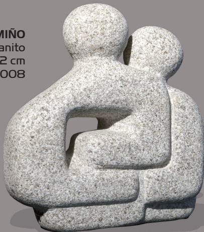
ALOUMIÑO Granito 44 x 40 x 12 cm 2008