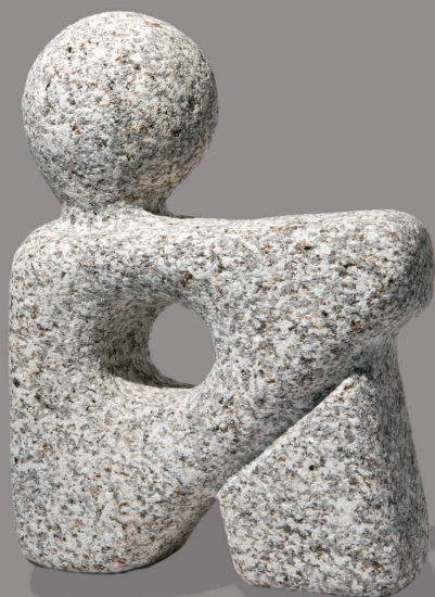
NENO II Granito 40 x 30 x 12 cm 2010